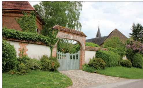
Hébécourt, l'entrée du domaine d'Hébécourt-le-Bas