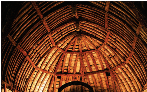
Mesnil-sous-Vienne, la charpente de l'église