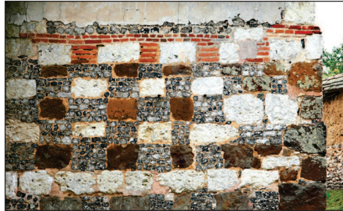
Mesnil-sous-Vienne, un mur de l'église