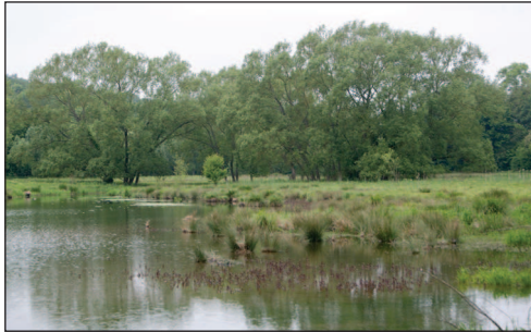
Mainville, le Grand Parc

La vallée de la Lévrière, entre Gisors et forêt de Lyons Dimanche 6 septembre 2015