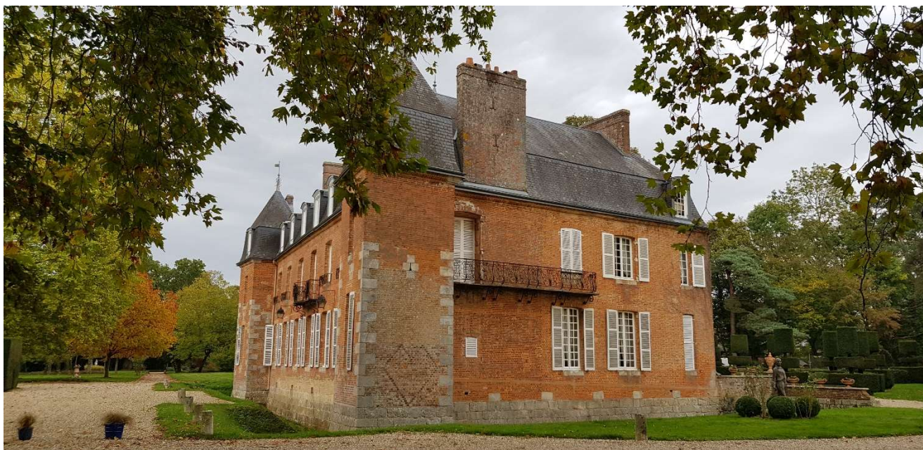
Le château de Bonneville