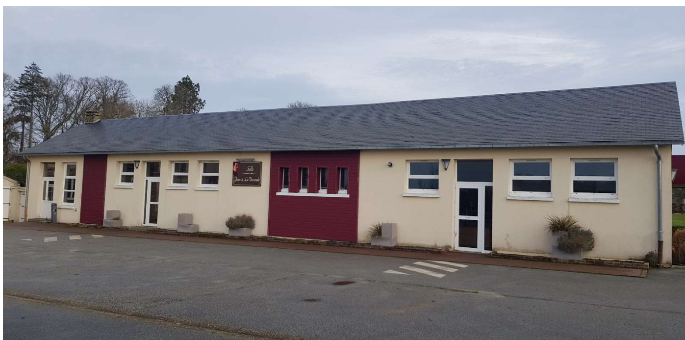
Salle des fêtes Jean de La Varende

Stationnement impératif des véhicules à l'arrière de la salle des fêtes (accès route du château d'eau)